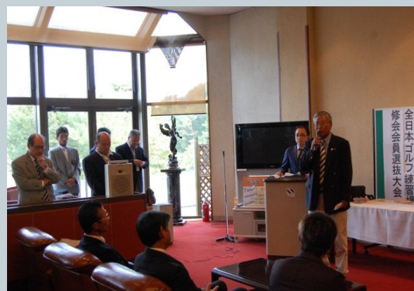
Golf Business Conference