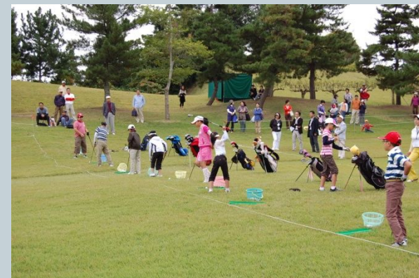
Junior golfers test & Events