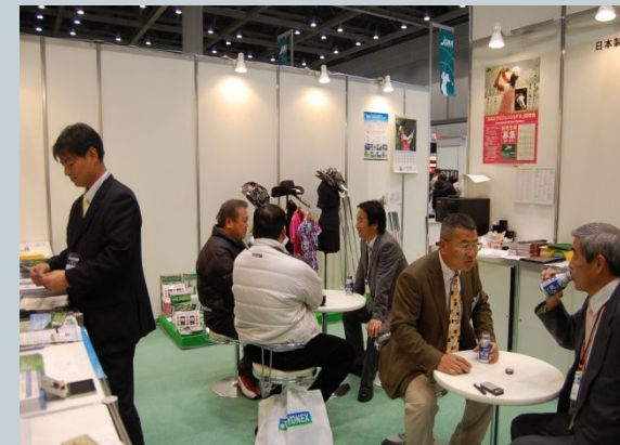
Japan Golf Fair stalls