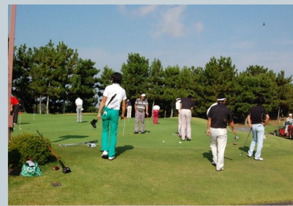
Golfer Golf Competition