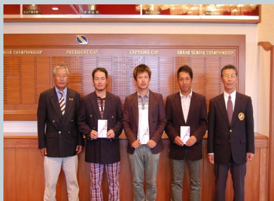
Awards for best golfer