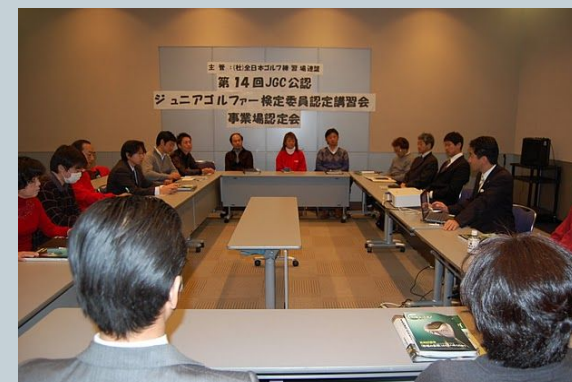
Golf Business Seminar